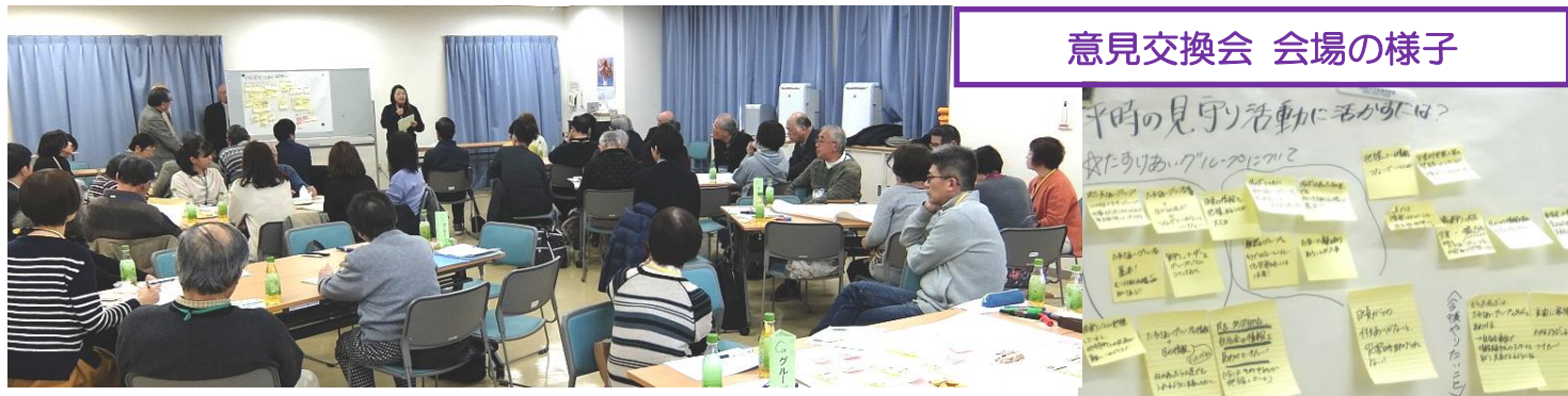
意見交換会 会場の様子

当防災拠点では大地震の際の安否確認については「災害時助け合いグループ」による情報収集を第一義に考えておりますが、今般提供を受ける要援護者情報は「災害時助け合いグループ」の活動を補完するものと位置付けて活用方法を検討したいと考えております。成案が得られた段階で改めて広報しますが、震災被害を極力抑えるための施策として皆さまのご理解・ご協力をお願いします。